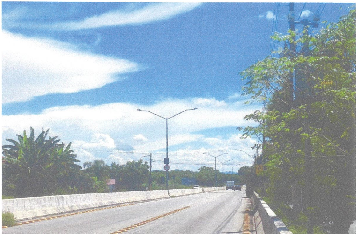
Vista do Local.